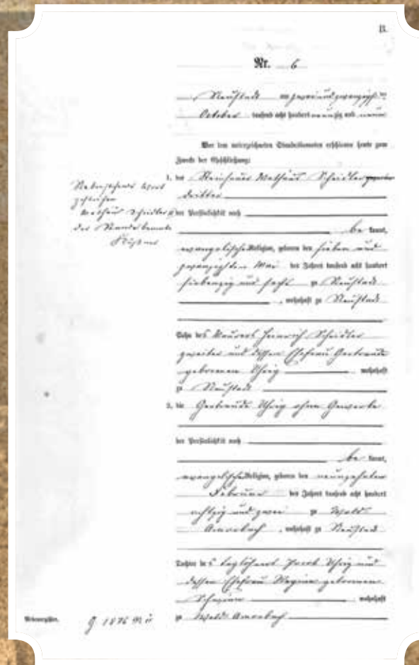
Heiratsurkunde Gertrude & Heinrich Scheidler

Sie bereist weiterhin Märkte und Volksfeste, um das Auskommen für sich und die drei Kinder zu sichern.